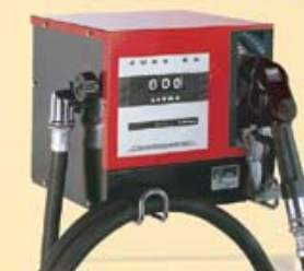
PARTICOLARE CUBE 56