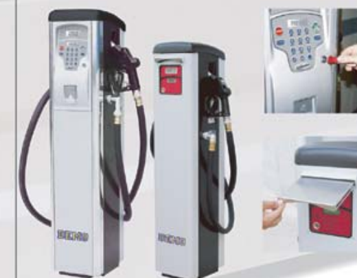
PARTICOLARE SELF SERVICE