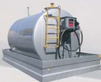
TANK-FUEL CUBE 70 MC