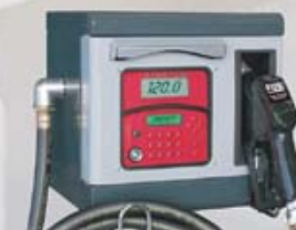
PARTICOLARE CUBE 70 MC