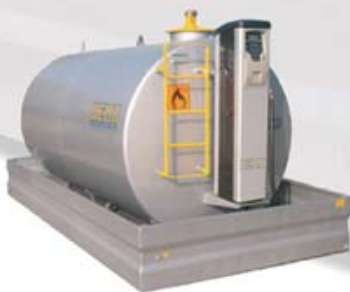
TANK-FUEL SELF SERVICE

Serbatoi omologati da Ministero degli Interni secondo il D.M. 19/03/90. Sono cisterne attrezzate con sistemi di erogazione, sono corredate di vasca di raccolta con contenuto pari alla metà della capacità reale del serbatoio. I serbatoi sono provvisti di scarico di fondo con tappo, tubazione di aspirazione da 1" con valvola di non ritorno con molla tarata, filtro di aspirazione, valvola a sfera da 1", passo d'uomo 400 tipo gasolio con carico da 3" con attacco rapido a baionetta in ottone, valvola limitatrice di carico al 90%, sfiato da 1"1/2 conforme al D.M. 12 Settembre 2003, con cappellotto tagliafiamma in ottone, indicatore di livello meccanico a galleggiante, dispositivo di blocco pompa al minimo livello, quadro elettrico, messa a terra, scaletta di servizio a partire dal 5000 litri. Possono essere corredate di tettoia di protezione, realizzata con profilo tubolare quadro zincato e copertura in lamiera recata zincata. Tutte le versioni possono essere dotate di filtro aggiuntivo