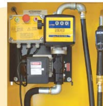
PARTICOLARE GRUPPI MECCANICI E/55 - E/80

SELF SERVICE 70 FM TANK Cisterne dotate di colonnine elettroniche con portata da 100 l/min., sistema di controllo dell'erogato, precisione nella portata +/- 0,5%. Gestisce n° 120 utenti con codice riservato e/o chiave elettronica, memoria locale fino alle ultime 255 erogazioni. Possibilità di inserire un ulteriore codice di identificazione dell'automezzo (registration number) ed il kilometraggio dello stesso (odometer), è munito di sistema di controllo del livello elettronico che in tempo reale calcola il quantitativo residuo del prodotto all'interno della cisterna, stampante remota, blocco pompa per minimo livello. Il trasferimento la gestione dei dati, avviene mediante apparecchiature aggiuntive e software gestionale.